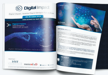
Sektör Yayınları, Kataloglar ve Dergi Reklamı