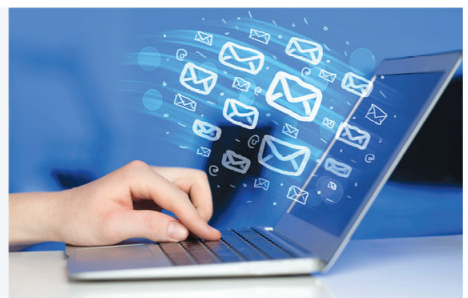
Toplu E-mail, E-bülten, Faks Gönderimi