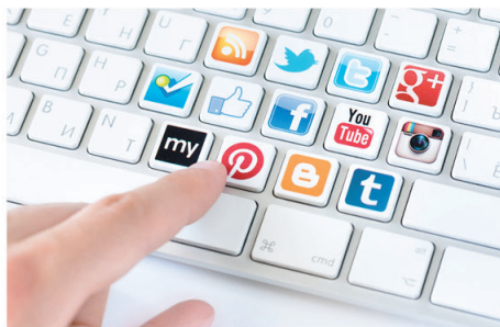
Sosyal Medya Reklamı